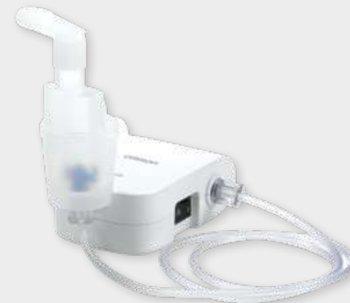
CompA.i.r Basic NE-C803

نبولایزر سبک، بی صدا و مقرون به صرفه با کیفیت منحصر به فرد قابل تفکیک