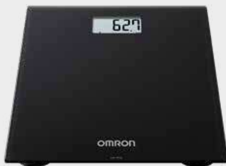
HN300T2 Intelli IT

مدیریت آسان وزن با HN300T2 Intelli IT و نرم افزار OMRON Connect